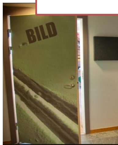
Exempel på tydliggörande miljö