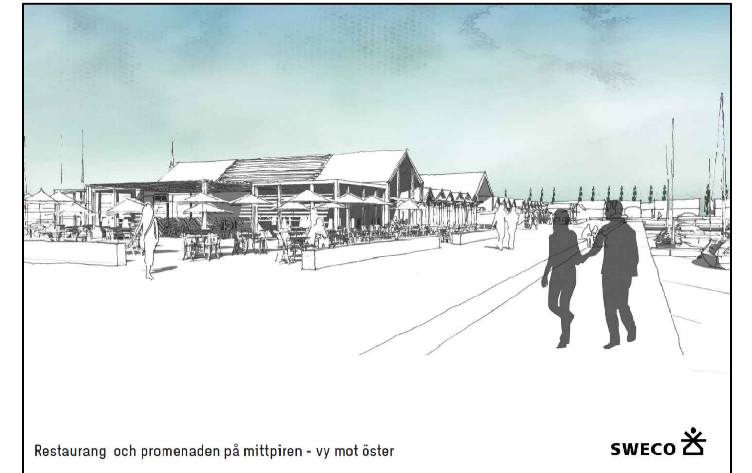
Restaurang och promenaden på mittpiren - vy mot öster