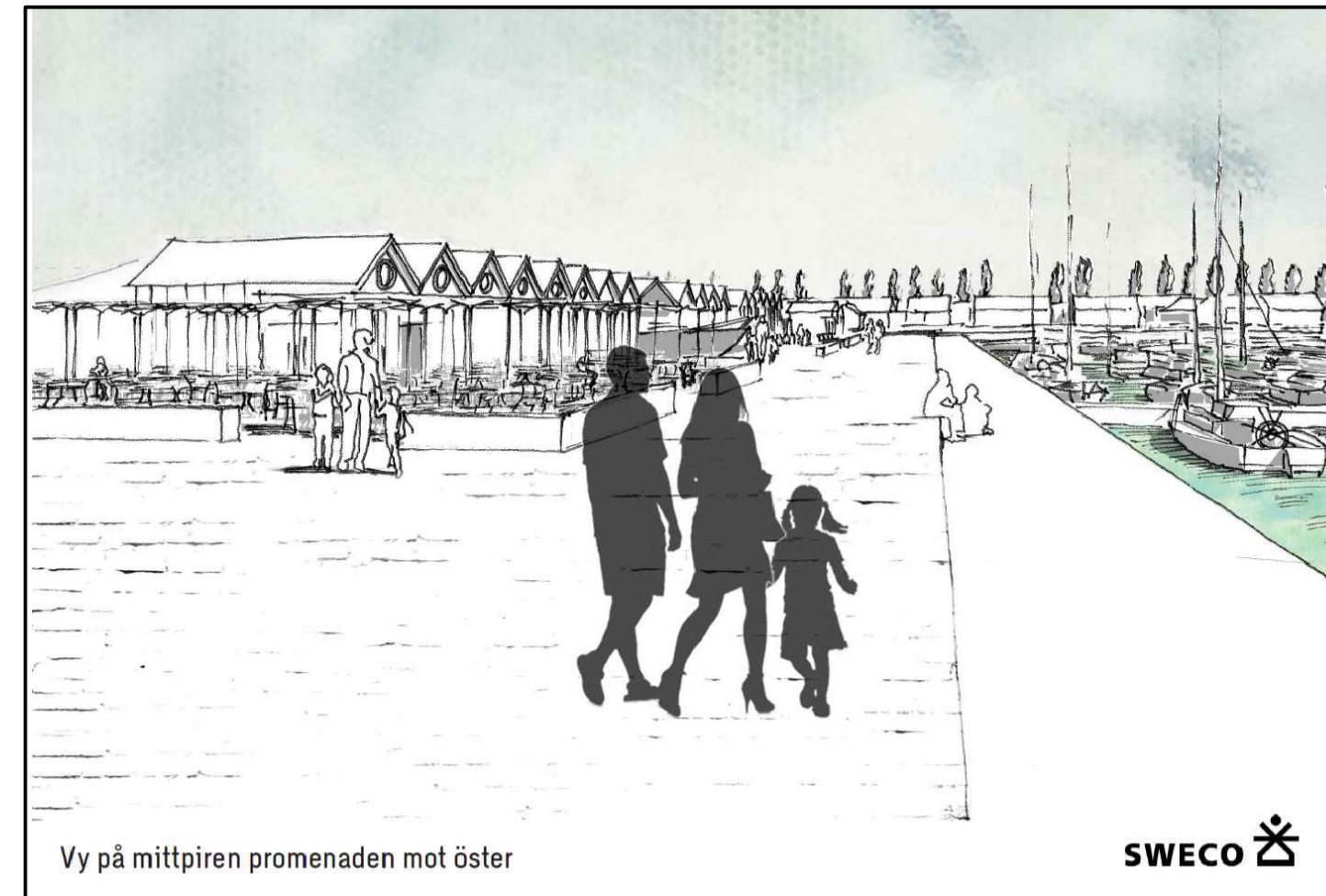
Vy på mittpiren promenaden mot öster