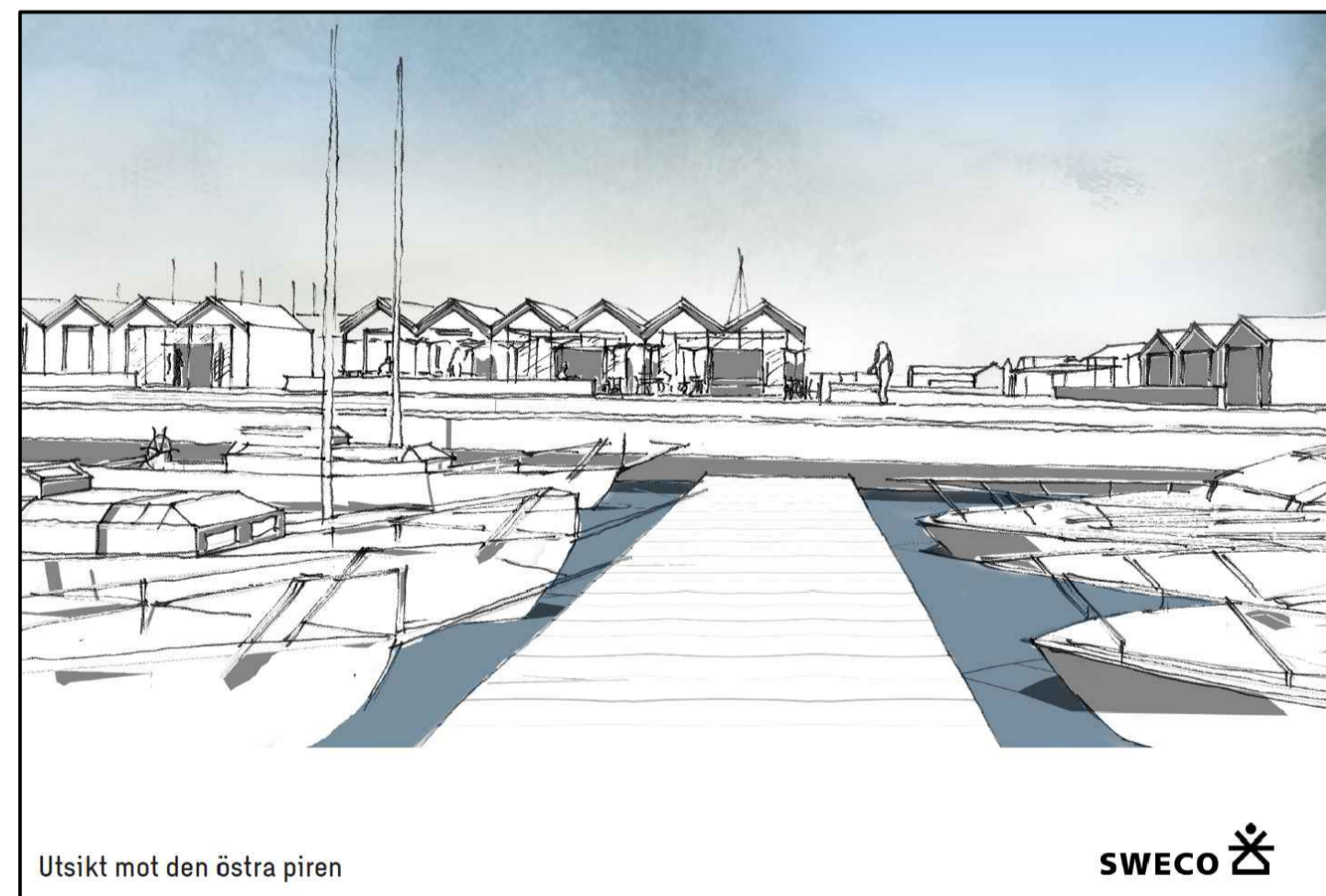
Utsikt mot den östra piren