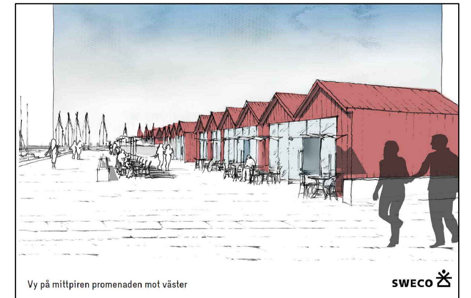
Vy på mittpiren promenaden mot väster